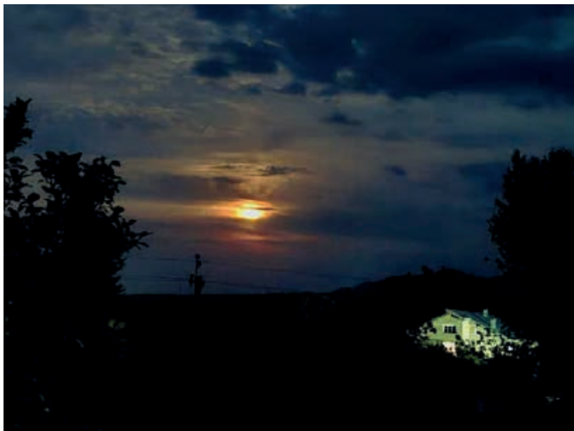
Картина художника Андрія Ренети, м. Косів