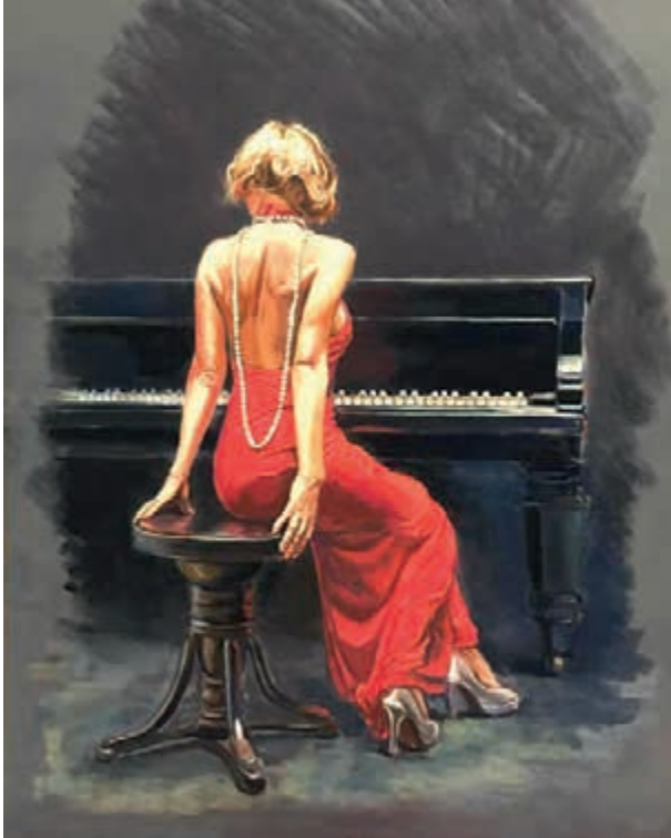
Картина художника Юрія Занічковського