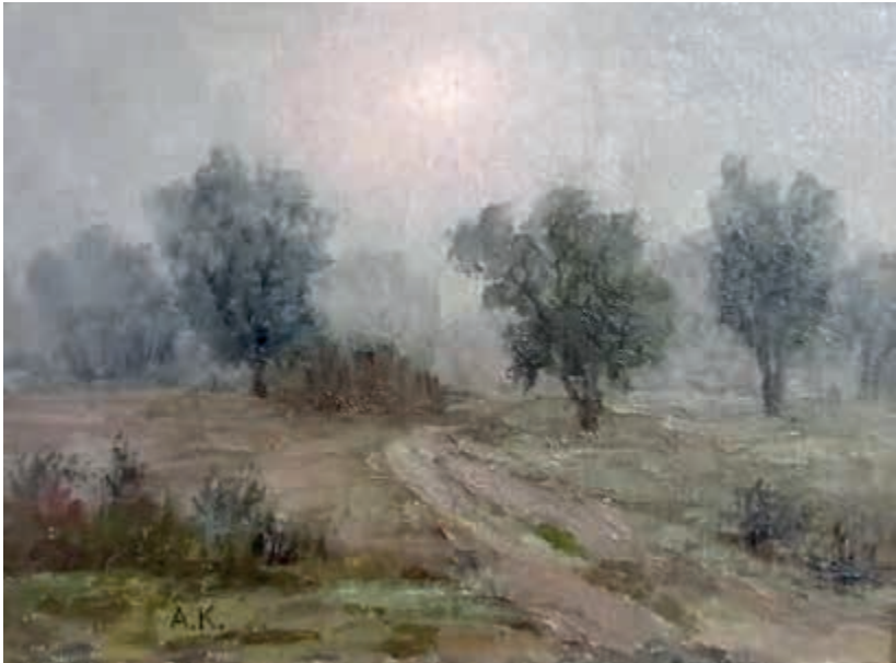
Картина художника Анатолія Кичинського