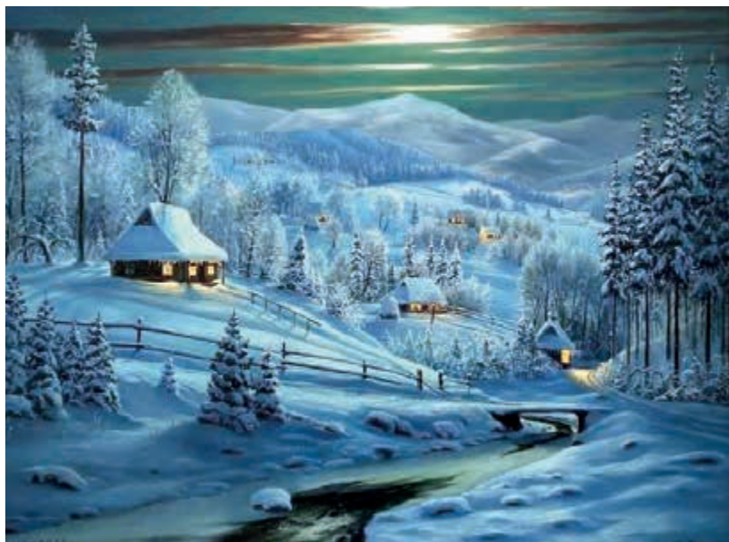
Картина художника Андрія Репети, м. Косів