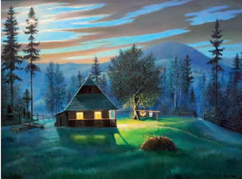
Картина художника Андрія Репети, м. Косів