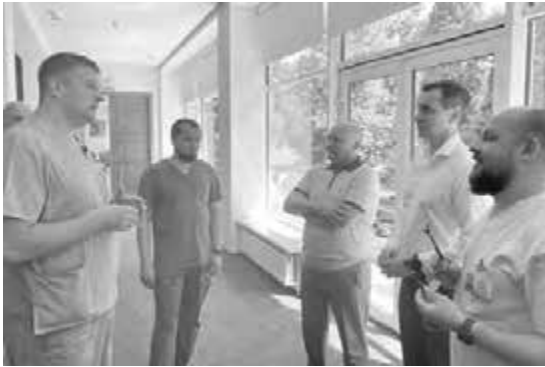
Міністр ОЗ України Віктор Ляшко та доктор Ігор Семенів в Інсультному центрі

Рішенням Головної акредитаційної комісії МОЗ України лікарні присвоєно вищу акредитаційну категорію. У 2003 році удостоєний звання Заслужений лікар України. І.П.Семенів був головою асоціації керівників закладів охорони здоров'я області.