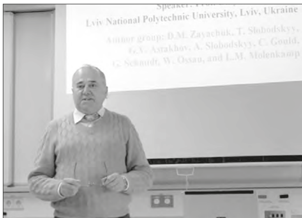
Технологічний інститут Карлсруе, Німеччина. Виступ на науковому семінарі, 2010 рік

ний редактор Вісника Державного (тепер Національного) університету «Львівська політехніка» (Електроніка) з часу його заснування 1998 р. Вчений секретар спеціалізованої вченої ради з