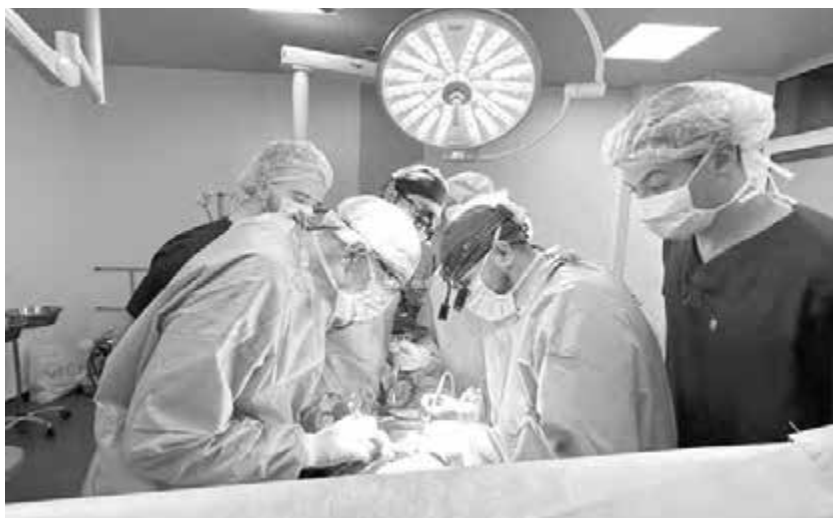
Операція в Центрі трансплантації органів

протоколи. Це потребувало видатків і зусиль, однак відтоді результати наших обстежень визнають у Європі та Америці».