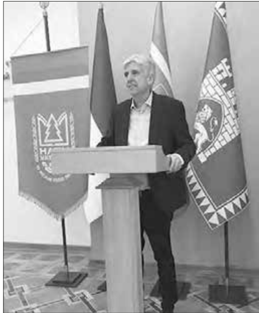
Виступ на спеціалізованій вченій раді із захисту дисертації

За час викладацької та науково-дослідної діяльності опублікував понад 220 наукових і навчально-методичних праць, серед яких 8 навчальних посібників, 6 монографій, 3 лабораторні практикуми та понад 90 статей у закордонних і вітчизняних періодичних наукових виданнях, зокрема і у міжнарод-