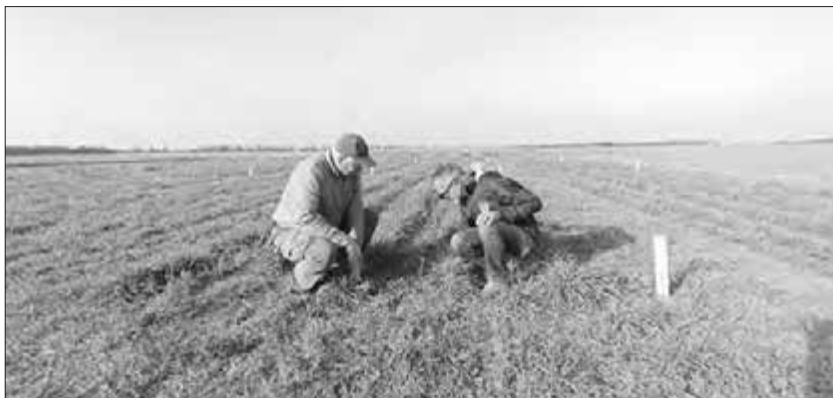
Експериментальні дослідження на полях Інституту кормів і с.-г. Поділля, Національна аграрна академія наук

чем про стан ґрунтів України на сесії EUSO (Європейська обсерваторія), на якій вперше Україна була включена до загальноєвропейського звіту «The State of soils in Europe».