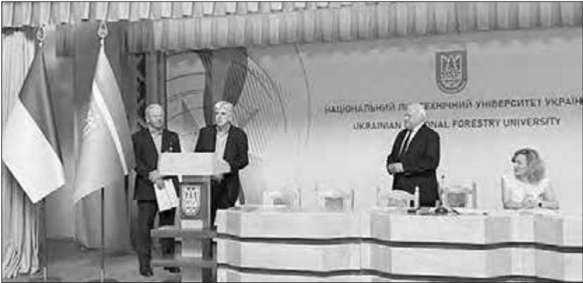
Академік Ярослав Генік (другий зліва) виступає на вченій раді Національного лісотехнічного університету України

грами міжнародного фонду Відродження «Екологічні проблеми культурно-історичних центрів Східної Європи» та «Співпраця громадських і державних організацій при ліквідації наслідків стихійних лих»).