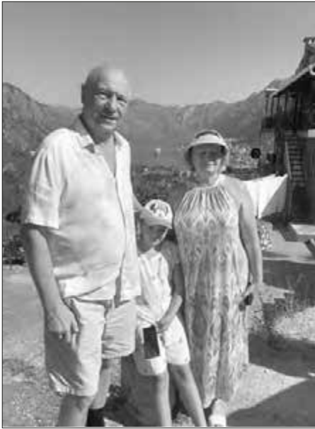
На відпочинку з дружиною і внучкою в Чорногорії

кового ступеня кандидата медичних наук за спеціальністю «Психіатрія».