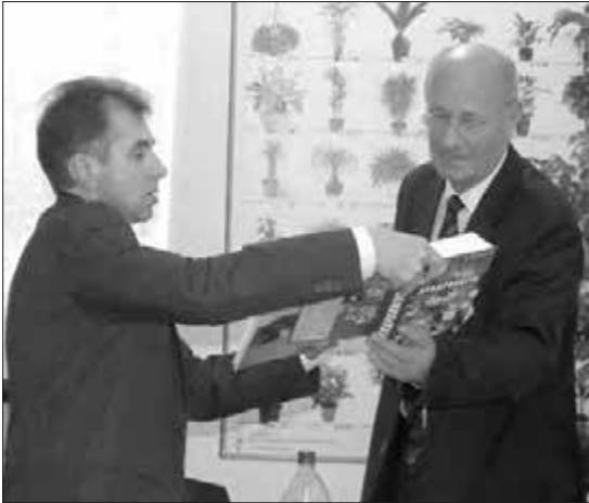
Презентація підручника «Дендрологія» в університеті Кишинєва (Молдова)

Викладає дисципліни: «Дендрологія», «Дендроекологія», «Біологія», «Ботаніка», «Недеревні ресурси лісу», «Недеревна продукція лісу», «Лісова сертифікація» для студентів спеціальностей «Лісове господарство», «Садово-паркове господарство»,