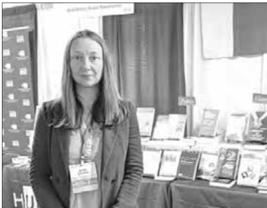
Біля стенду видавництва Українського інституту Гарвардського університету

В и к л а д а л а курси з української мови та курс про жінок і жіночі теми в українській літературі на катедрі слов'янських мов та літератур Університету То-