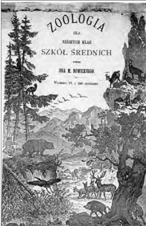
Обкладинка підручника д-ра М. Новицького «Зоологія» для середніх шкіл.

барії. М.Новицький активно збирав гербарії для навколишніх