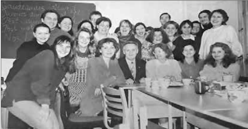
Студенти відділення класичної філології Гродненського і Гданського університетів разом із зав. кафедрами. Гродно

культетів (філологів, істориків, юристів, біологів). Водночас працював у гімназії з учнями 8-10 класів.