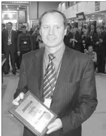
З дипломом Міжнародної виставки в Києві, 2006 р.

Одружений, одружився в Заполяр'ї, Мис Кам'яний, Тюменської обл. Сім'я проживає у Пермі, мають дочку. Дружина – інженер, працювала в НДІ, а дочка – маркетолог, працює в Санкт-Петербурзі.