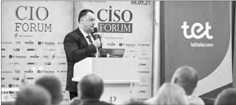
Проф. Тарас Ткачук виступає на Міжнародній конференції з кібернетики

Його дослідження спрямовані на пошук рішень для зміцнення інформаційної безпеки держави, зокрема в контексті адаптації українського законодавства до стандартів ЄС. Він також розглядає роль міжнародних фінансових інституцій і приватних інвестицій у післявоєнному відновленні України, підкреслюючи значення технологій для стійкого розвитку.