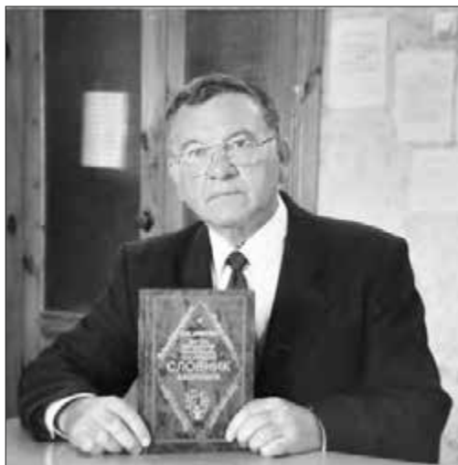
Проф. Юрій Цимбалюк презентує свій «Словник афоризмів»

ситету Й.І.Кобовим. Це, зокрема, художні переклади з латинської та старогрецької мов: «Метаморфози, або Золотий осел Апулея» (1982); «Дамоклів меч (антична новела)» (1984); Петроній «Сатирикон» (1986); «Листи темних людей» (1987); «Місто сонця» (1988); Плутарх «Порівняльні життєписи» (1991); «Біблійна мудрість у латинських