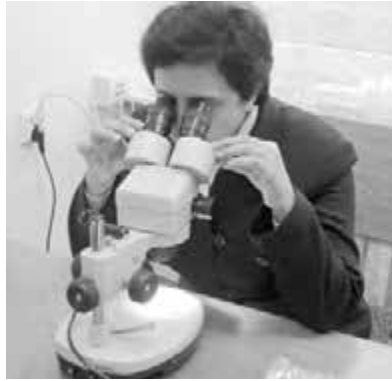
У лабораторії Природничого університету м. Люблін

Люблін, Католицьким університетом (м. Люблін, Польща), університетом м. Павія (Італія), університетом ім. Маріо-Негрі (м. Мілан, Італія), Інститутом лісу (м. Мадрид, Іспанія), Чорногірським університетом (м. Подгоріца, Чорногорія), Лісотехнічним університетом (м. Софія, Болгарія), заповідниками, ботсадами Польщі та України. Регулярно бере участь у міжнародних ботанічних експедиціях. Досліджувала флору та рослинність Альп, північних районів Італії, Апеннін, гірських масивів Піренеїв (пояс маквіса), узбережжя Лігурії та Адріатики, Лазурного узбережжя, вивчала флору та рослинність південно-західного макросхилу Монте-негро.