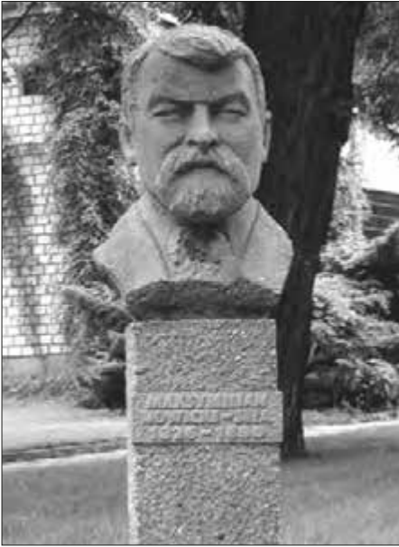
Пам'ятник М. Новицькому на території музею рільництва в Шреняві (Польща)

річне відрядження до Відня для занять в імператорському природознавчому музеї. Цього одного року навчання йому було достатньо, щоб інтенсивно зайнятися самоосвітою, згодом стати одним з найвідоміших у Європі зоологів, завдяки чому отримав право у 1858 році перейти на викладацьку роботу до своєї рідної Львівської академічної гімназії. У цьому ж 1858 році Новицький опублікував свою першу наукову працю про жуків. Займається ентомологією, видаючи в 1860 році каталог метеликів