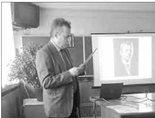
Виступ на засіданні наукового семінару, 2019 р.

торських свідоцтва та 6 патентів на винаходи.