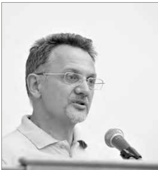
Проф. Юрій Дмитрук виступає на з'їзді грунтознавців та агрохіміків. м. Харків, 2018 р.

Українського ґрунтового партнерства з 2019 р. та ESP – Європейського ґрунтового партнерства – по теперішній час; член INSOP – міжнародної організації з моніторингу забруднення ґрунтів; президент (2011 – 2018 рр.) та віце-президент (2018 р. – дотепер) громадської організації ґрунтознавців та землекористувачів «Терра»; національний експерт з питань