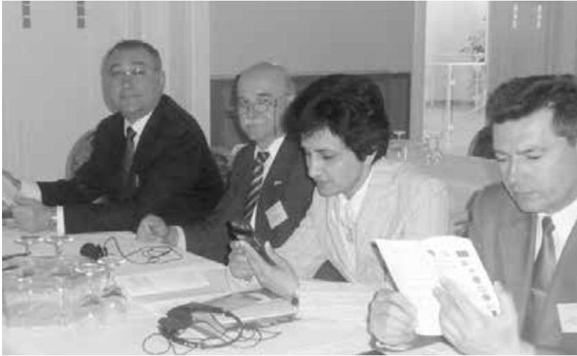
На Міжнародній конференції в м. Ерфурті (Німеччина)

винознавства та недеревних ресурсів лісу НЛТУ України. У 2012 році їй присвоєне вчене звання професорки кафедри ботаніки, деревинознавства та недеревних ресурсів лісу НЛТУ України.