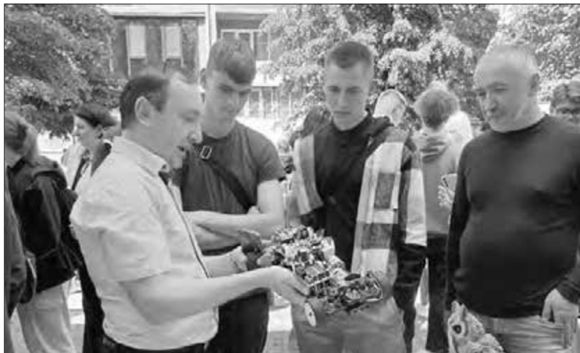
Демонстрація безпілотного колісного робота на науковому пікніку «Наука заради миру», 2024 р.

тем збору та обробки інформації», де навчає студентів спеціальності «Інженерія програмного забезпечення» практичних навичок з розробки та програмування засобів штучного інтелекту, автономних роботів та кіберфізичних систем. Під його керівництвом студенти були переможцями II етапу Всеукраїнського конкурсу студентських наукових робіт та II етапу Всеукраїнської олімпіади з «Програмування мікропрограмних автоматів та мікроконтролерних систем».