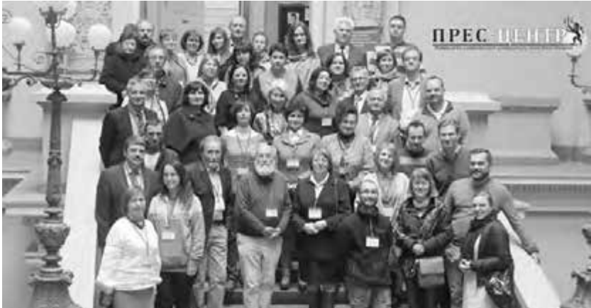
Академікня Мирослава Сорока (в центрі) серед делегатів Міжнародної конференції в ЛНУ ім. Івана Франка

вого вісника НЛТУ України, Наукових праць Лісівничої академії наук України, Наукового журналу «Ukrainian journal of forest and wood science» (індексований у базі Scopus, м. Київ).