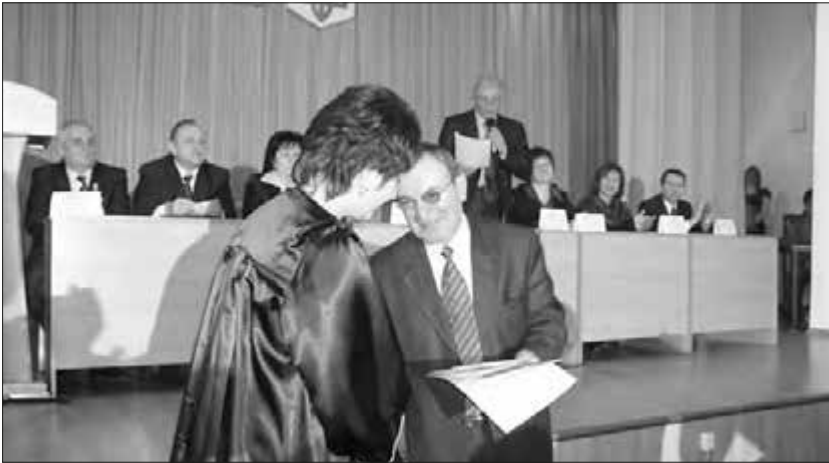
Проф. Іван Солоненко вручає диплом магістра державного управління випускникам, 2011 р.

Вікторії (Канада), Єрусалиму (Ізраїль), Копенгагена (Данія), Братислави (Словаччина), Будапешта (Угорщина), Праги, (Чехія) та ін.