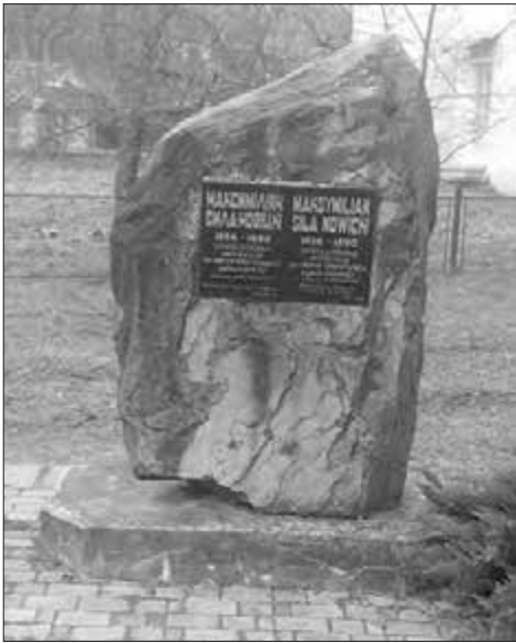
Меморіальний знак, встановлений в Яблуніві

році публікує працю присвячену риbam Вісли і Галичини з погляду рибальства. У 1887 за його клопотання прийнято нове рибальське законодавство, у 1888 році провів картографування розповсюдження риб в Галичині, а в 1889 році видав атлас риб Галицьких річок: Вісли, Стиру, Дністра і Пруту.