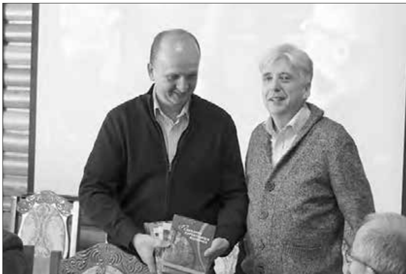
На презентації наукового видання «Порадник Карпатського лісівника»

них виданнях включених до наукометричних баз Scopus та Web of Science.