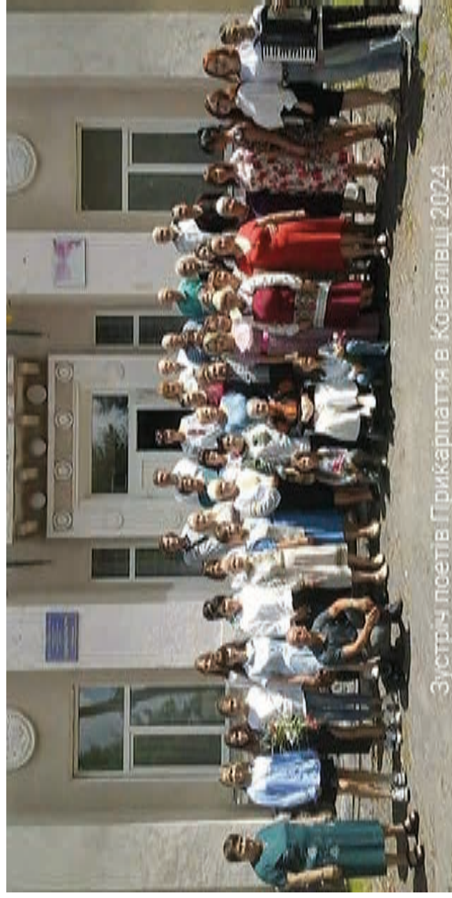
Зустріч псетів Прикарпаття в Ковалівці 2024