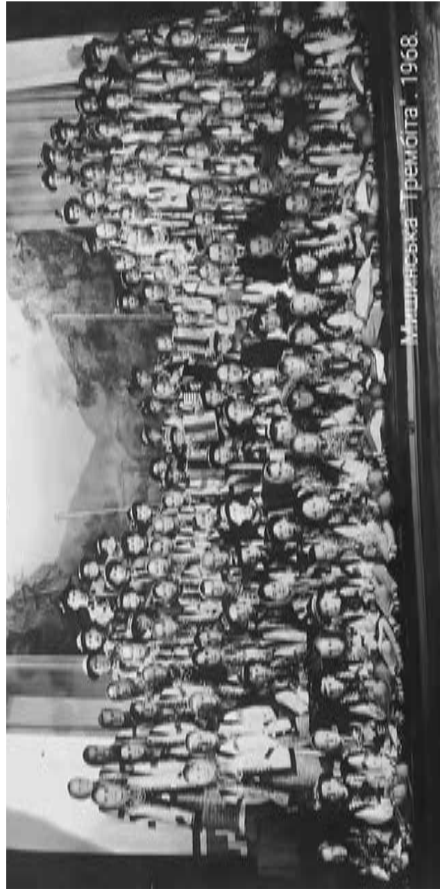
Мінская Трэмбіта. 1968.