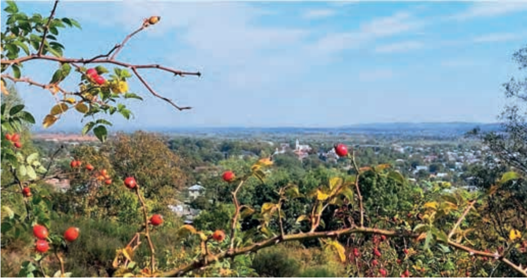
Споглядаючи Кути з гори Овидій

Мої Кути - зелена хустина, Закошичена сонячним літом. На ній кожна доріжка-стежина Яблуневим посипана цвітом. Килимів царинкових узори, Різнобарв'я дивних вишиванок, Кучерявих садів буйне море, Вмілі руки кутян і кутянок. Це моя Прикарпатська перлина, Де віками талант процвітає. Навіть жовта, липка глина У гончарських руках оживає.