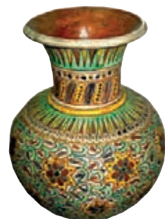
Керамічні вази Івана Брошкевича