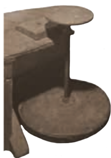
Гончарний круг майстра