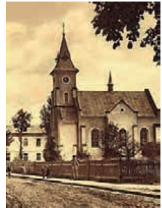
Костел, Кути 1930-ті рр.

творцем – малював форми виробів і декорував на сформованих братом творах, а другий – осягнув технічне моделювання і випалювання. У такому творчому тандемі вони проявили багато фантазії. Декоруючи свої твори, майстри однаково використовували як орнаментальні мотиви з килимів і вишивки, так і форми античні, використовували східні орнаменти (наслідки вірменської колонії)” [5]. Як бачимо, керамічна майстерня династії Брошкевичів була відомою у свій час, а її вироби користувалися попитом та повагою серед мешканців нашого краю і далеко за його межами.