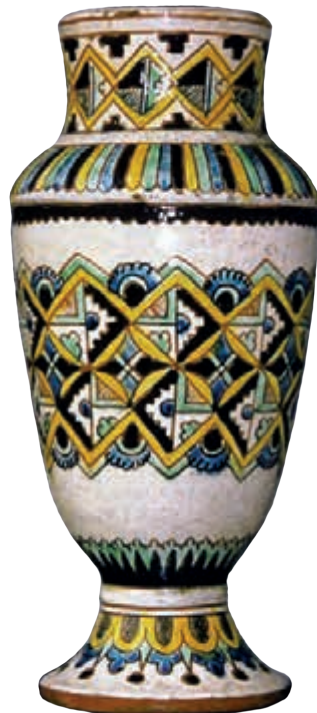
Вази роботи синів Брошкевича 20-30-і рр. XX ст.