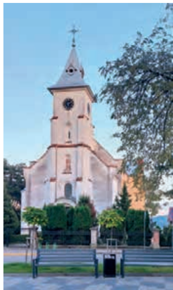
Костел, Кути 2024 р.

Д ослідження статуї Ісуса Христа на фасаді костелу Пресвятого Серця Ісуса Христа в Кутах виявили, що майстри у Кутах виготовляли не лише вироби вжиткового призначення, а й сакральні твори і навіть монументальні статуї.