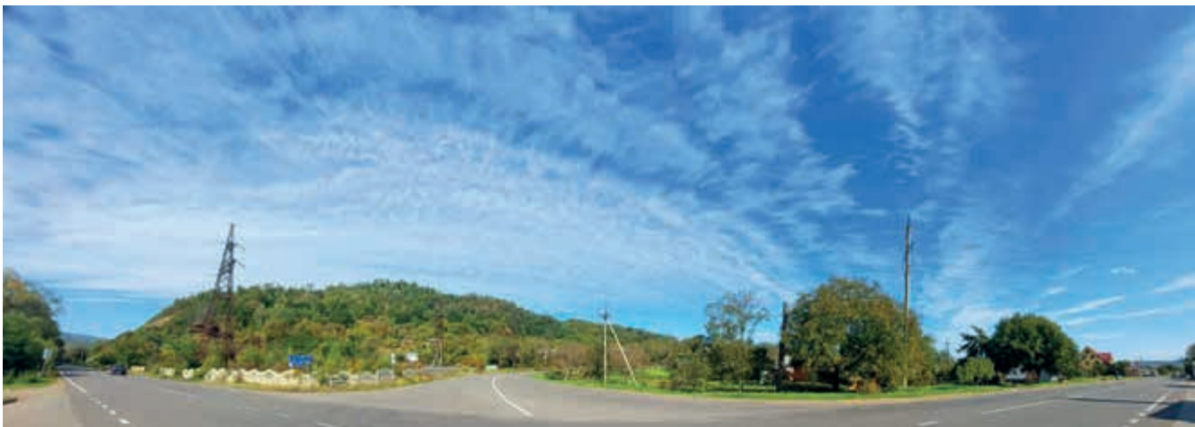
Дороги, що ведуть до Кутів