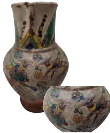
Кутський керамічний глек XIX ст.

Становлення гончарства в Кутах відбувалося з XV століття. У 1715 році Кути отримали магдебурзьке право і мали свій Герб, на якому було зображено срібну міську браму з відкритими ворітьми на блакитному тлі. І це свідчить про те, що у свій час Кути були містечком-фортецею. Отримання магдебурзького права стало одним із методів здобуття певної автономії, правового захисту та сприятливих умов для розвитку ремесел і торгівлі. Таким чином, одна із окраїн виокремилася в окрему адміністративну одиницю – Старі Кути. А в 1717 році Й. Потоцький надав привілей вірменам, які прибули сюди із Молдовського князівства. Вірмени займалися торгівлею та різними ремеслами. Вони замовляли у місцевих гончарів керамічний посуд для свого побуту та торгівлі. І це також, так чи інакше впливало на стилістичні форми глиняних виробів та їх декорування.