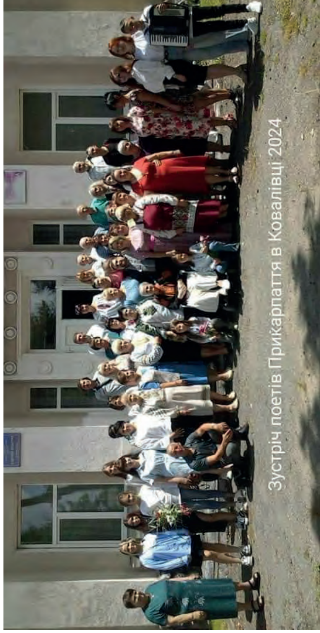
Зустріч поетів Прикарпаття в Ковалівці 2024