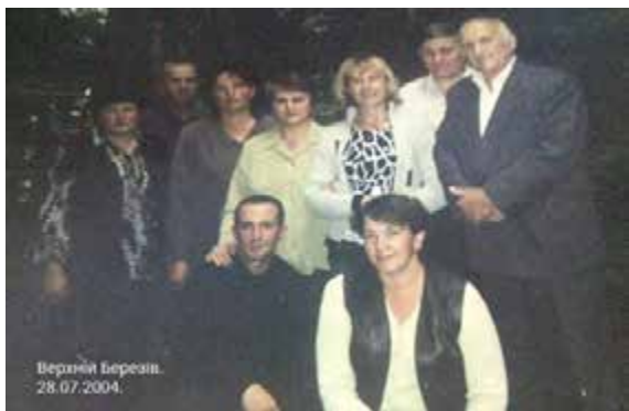
Верхній Березань. 28.07.2004.