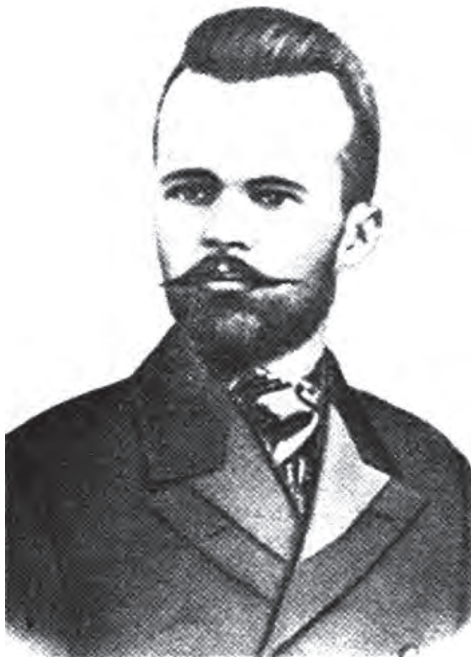
Марко Черемшина (13.07.1874-25.04.1927)