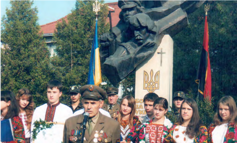
Уроцистості з нагоди 65-річчя створення УПА біля пам'ятника борцям за волю України м. Косів. 14.10.2007р.