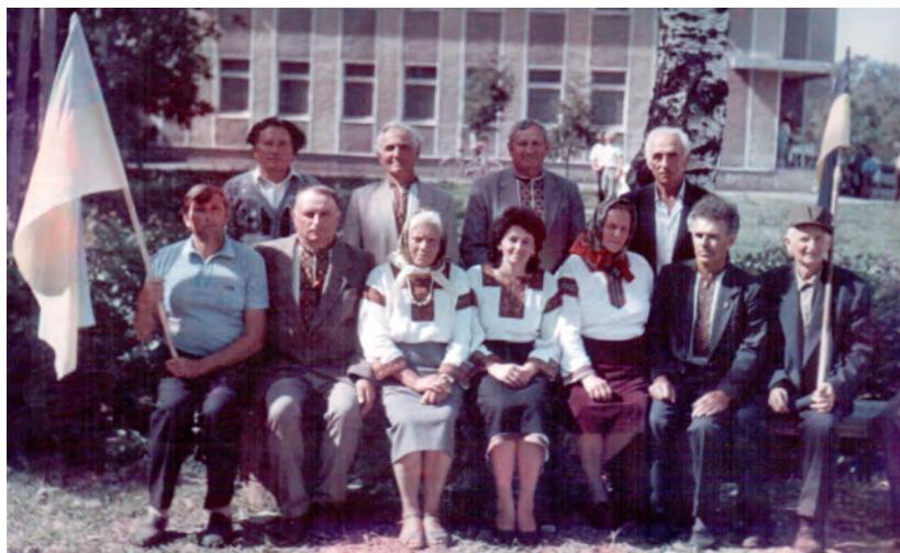
Члени Хімчинського осередку Народного Руху України на посвяченні могили в с. Рожнові 1992р.