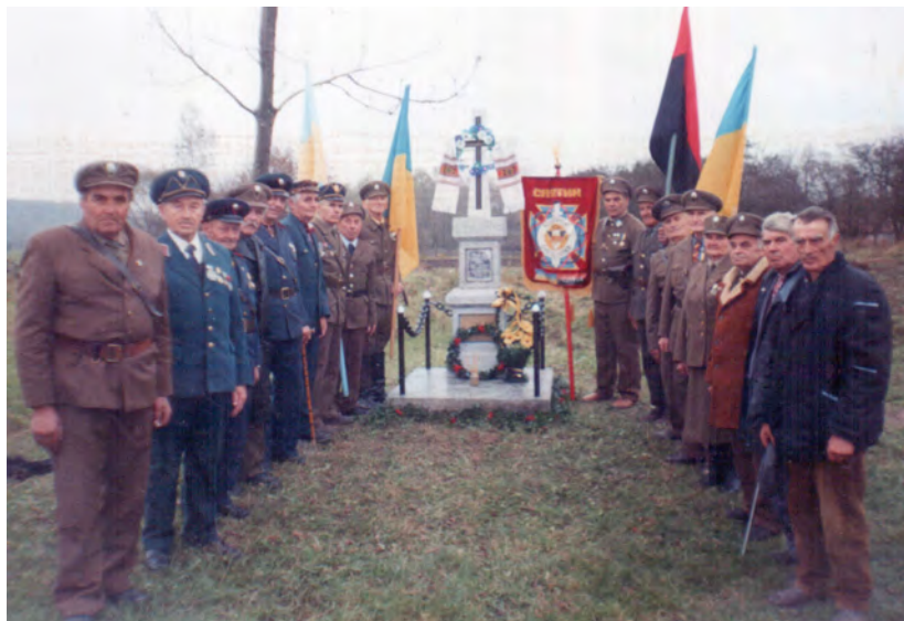
Косівське і Снятинське Братство на посвяченні хреста на місці загибелі вояків УПА, с. Новоселиця Снятинського р-ну