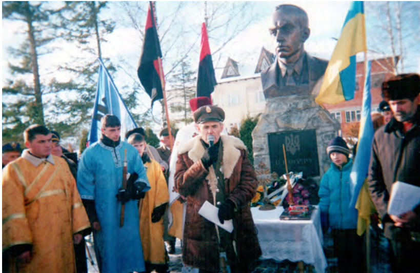
Посв'ячення оновленого пам'ятника С. Бандери в с. Середньому Березові Косівського району. 9.01.2009р.