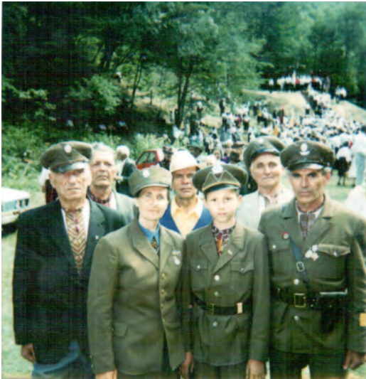
Хімчинський Осередок Братства на святкуванні річниці переможного бою в Рушорі під Космачем.