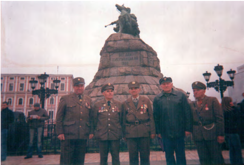
Відзначення 65-тої річниці створення Української Повстанської Армії, м. Київ. 2007р.