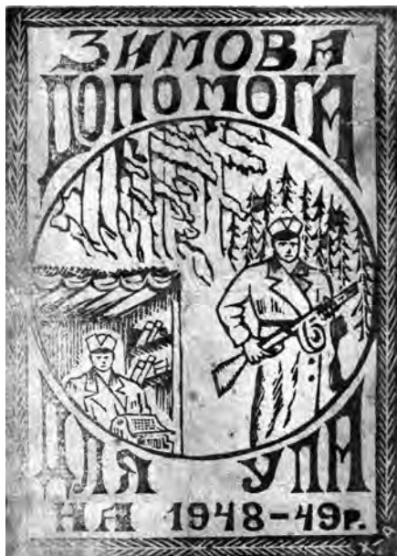
Бефони УПА (облігації) Зимова допомога для УПА на 1948-1949рр.