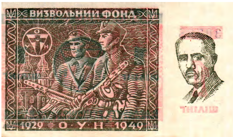
Визвольний фонд ОУН 1929-1949рр.