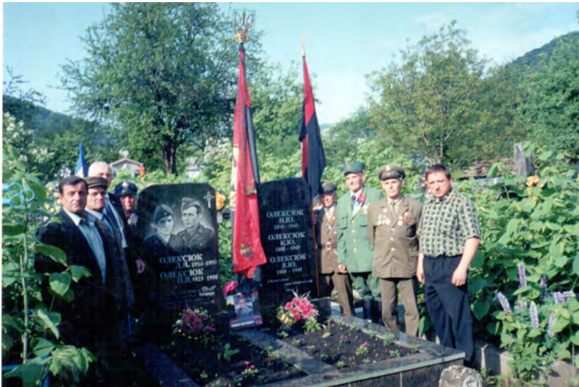
с. Шешори 2007р. Відкриття пам'ятника борцям за волю України «Ілаку» та його дружині.