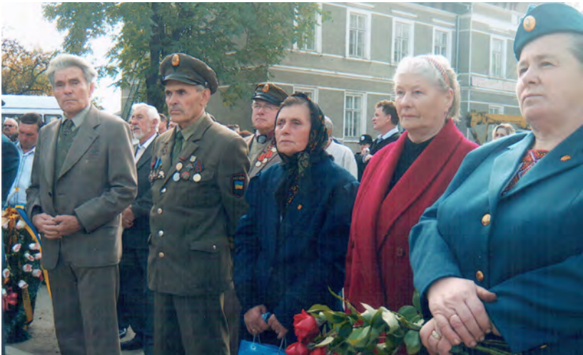
Ветерани УПА. Біля пам'ятника борцям за волю України, м. Косів 22.10.2008р.