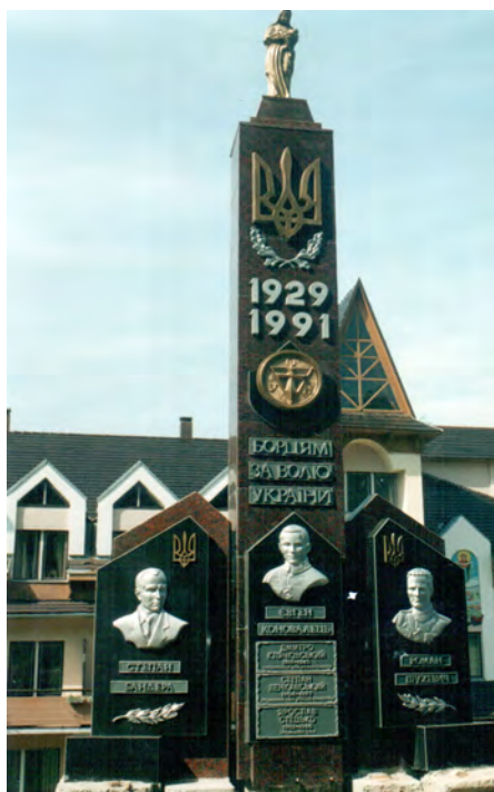
Моршин, санаторій «Говерла», – пам'ятник борцям за волю України.