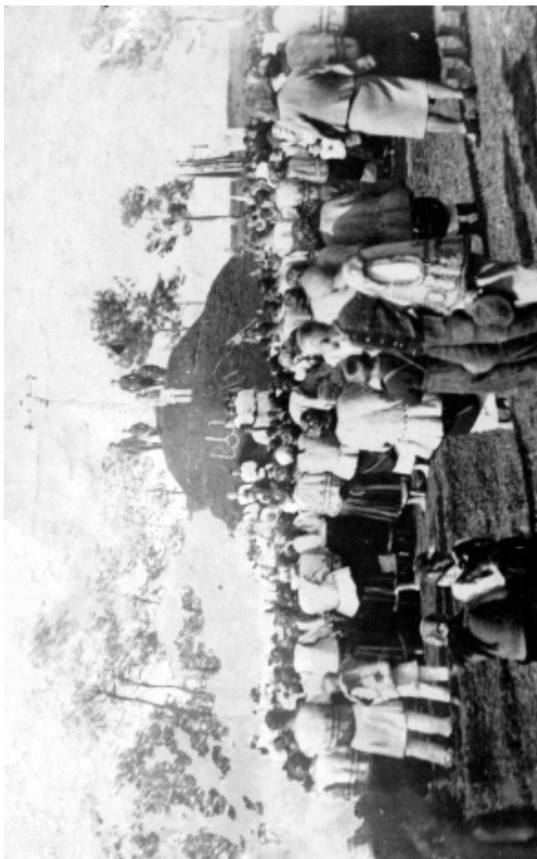
Відкриття стрілецької могили