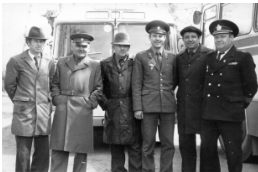
Ось вони «герої», які керували руйнуванням церкви