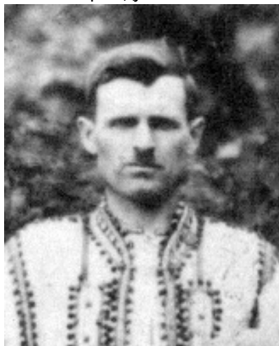
Василь Федорук, псевдо Береза, керівник резервного сільського підпілля ОУН