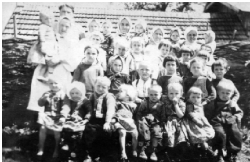
Дитячий садок у 1942 році