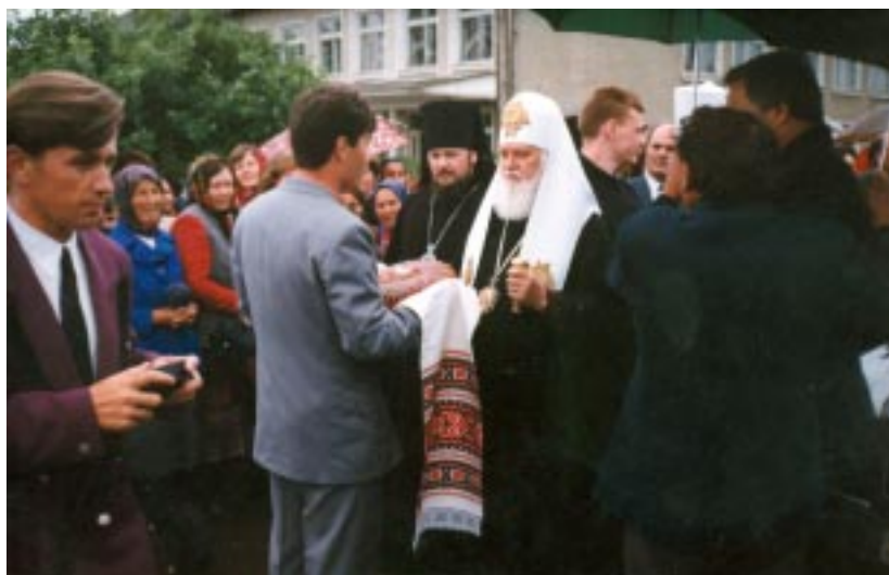
Вітання на топорівській землі