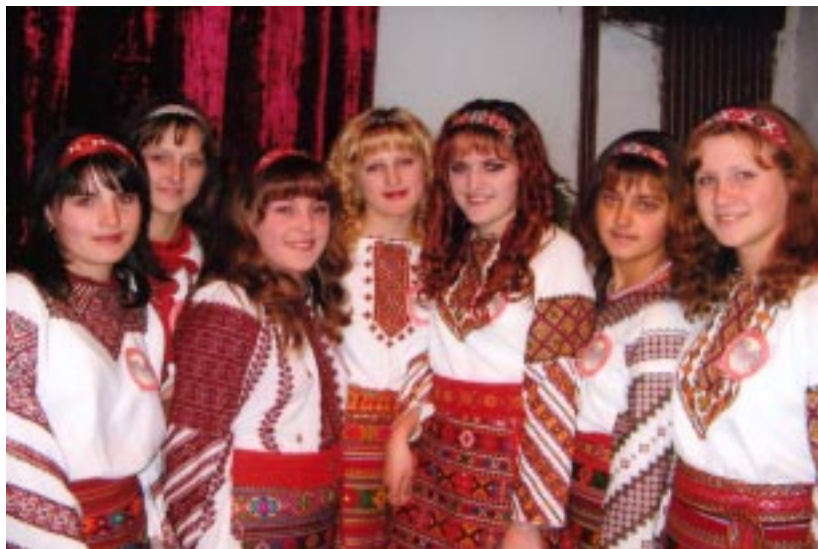
Учні Топорівської середньої школи. 2007 рік