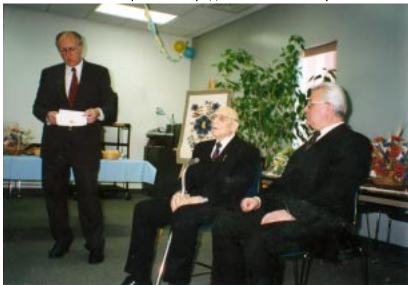
Перший Президент України Леонід Кравчук на прийомі у керуючого українськими кредитовими банками США п. Мирона Баб'юка. Посередині сидить колишній житель с. Топорівці – п. Теодор Баб'юк