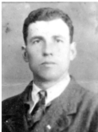
Григорій Сливчук, псевдо Довбуш, член ОУН