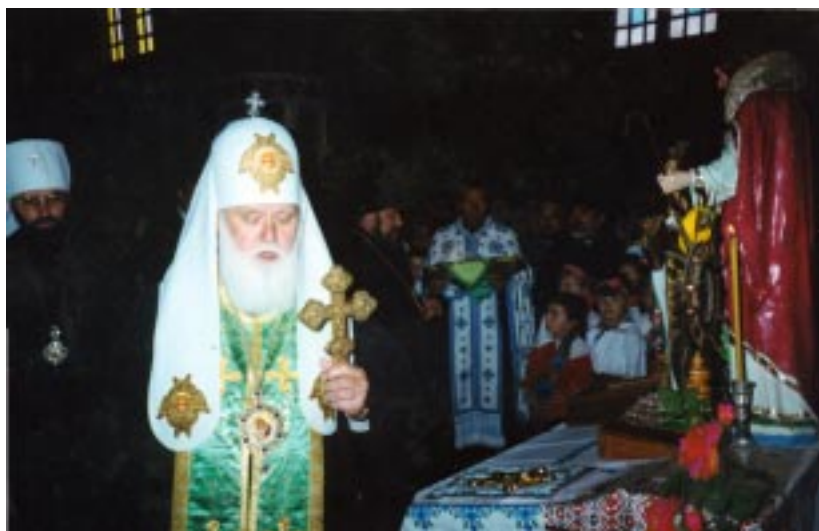
Відправа у церкві